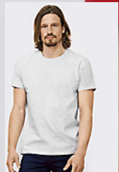
SOL'S IMPERIAL 11500